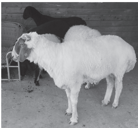
חוות החופש בעולש