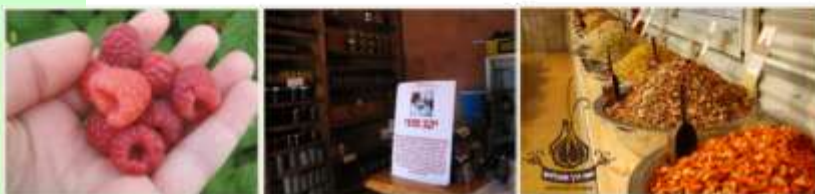
תיירות חקלאית

הכתבה הפותחת היא של ד"ר דלית גסול ממכללת כנרת שבעמק הירדן שהכינה עבודה על תכנית אב לתיירות חקלאית בעמק הירדן. עד היום גובשו תכניות אב רבות לתיירות, אך תכנית זו היא הראשונה לתיירות חקלאית. בימים אלה אנו בוחנים בעזרת משרד התיירות את האפשרות לפתח את המוצר התיירותי שנקרא תיירות חקלאית וניסיונה של דלית יתרום לנו רבות.