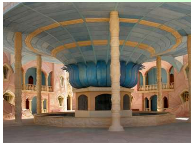
חצר בית האומנויות