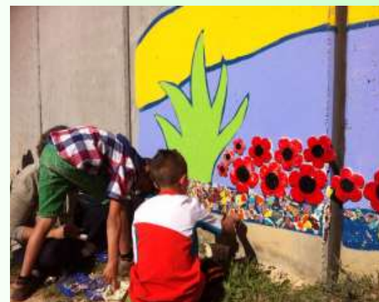
נתיב לשלום בנתיב העשרה

שני יישובים במועצה: כוכב מיכאל ונתיב העשרה - הרימו את הכפפה גבוה מאוד בתחום התיירות ובימים אלו זוכים להצבת השילוט התיירותי שהמועצה גייסה עבורם ממשרד התיירות. ביישובים אלו פועלים עסקים תיירותיים רבים ומגוונים (10 בנתיב העשרה, ו-17 בכוכב מיכאל). בכל יישוב פועלת התארגנות המהווה דוגמה להתנהלות יישובית מוצלחת. כל אחד מהם עיצב לוגו משלו והפיק חומרי פרסום משותפים לכלל היזמים שבתחומו. כן ירבו יוזמות תיירותיות כאלו שיהוו מקור לגאווה במועצה!