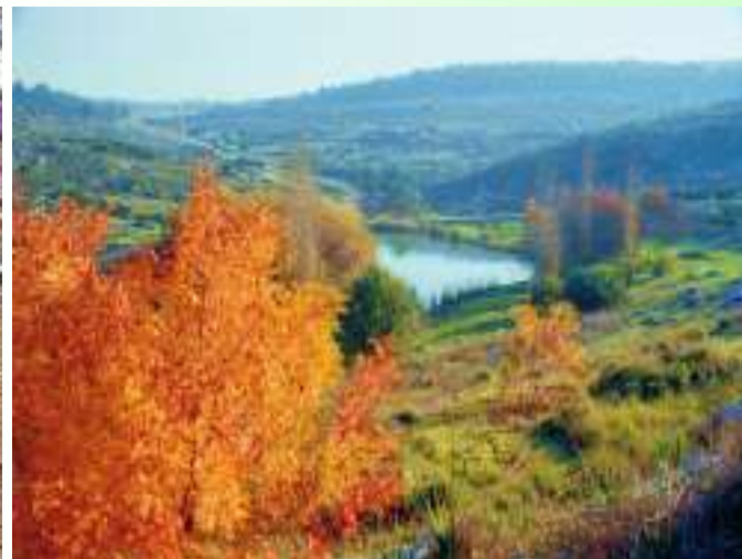
שלכת בברכת הערבות