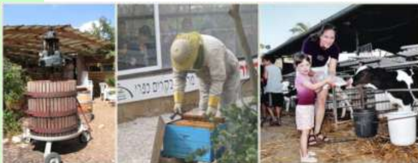
"תיירות חקלאית" הינה פעילות תיירותית הקשורה ישירות לסביבה היצרנית של ענפי הגידול, כאשר ספקי המוצר התיירותי, עוסקים ישירות בחקלאות"