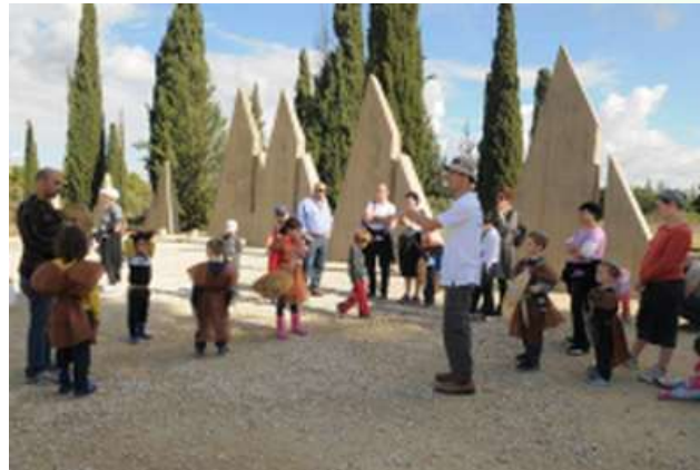
הפעלות ילדים בפסטיבל המכבים

כל הפעילויות המופקות כיום על ידי העמותה בימי הפסטיבל מהוות תמיכה ועיבוי לסך האטרקציות התיירותיות והקולינריות המוצעות בחבל, כגון: הבאת סדנת שף מוכר אל מחלבת גבינות איכותית בחבל, סדנאות טעימות יין ביקבים, הוספת הצגה ברוח חג השבועות לחוות הגדולות הפתוחות בחבל ועוד. הקונספט התקבל בהצלחה רבה, ואכן ברוח זו הפיקה עמותת התיירות שני פסטיבלים מושכי קהל מוצלחים בחג השבועות 2013 ו-2014, ועוד היד נטויה.