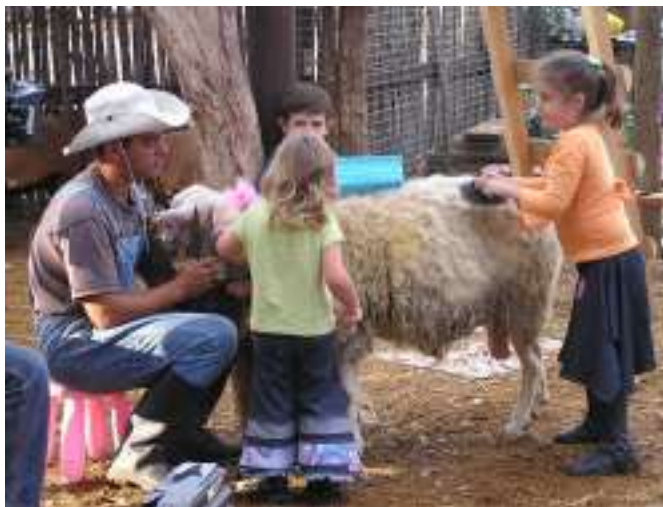
גז בבית האיכר

כאסטרטגיה ראשית, לצד עבודת שיווק במהלך השנה כולה, נקבעו שני מועדים בשנה לעריכתם של קמפיינים גדולים מושכי קהל – "פסטיבלים". כחבל ארץ חקלאי במרכז הארץ, הסתמן חג שבועות, חג חקלאי במהותו, כמוקד חשוב במיתוג ובהעצמת התיירות הכפרית-חקלאית בחבל מודיעין. בשנת 2012 התקיים לראשונה פסטיבל שבועות תחת הכותרת: "חגיגה בלבן בחבל מודיעין", בתמיכת משרד החקלאות ופיתוח הכפר. האירוע המרכזי בפסטיבל היה הפנינג חד-יומי גדול באסרו חג שבועות באתר חיל התחזוקה שלמרגלות תל חדיד. האירוע המוצלח משך מבקרים רבים וגרף ביקורות חמות. עם זאת, כחלק מהפקת הלקחים מהאירוע, הוחלט שבעתיד יחולק התקציב לכמה ימי פעילות בחג השבועות, ולא יושקע רובו ככולו באירוע חד-יומי מרכזי אחד.