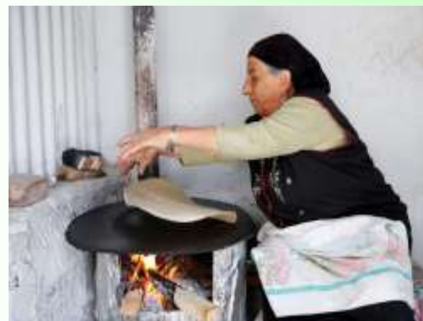
פרויקט שבילים ובישולים בברקת