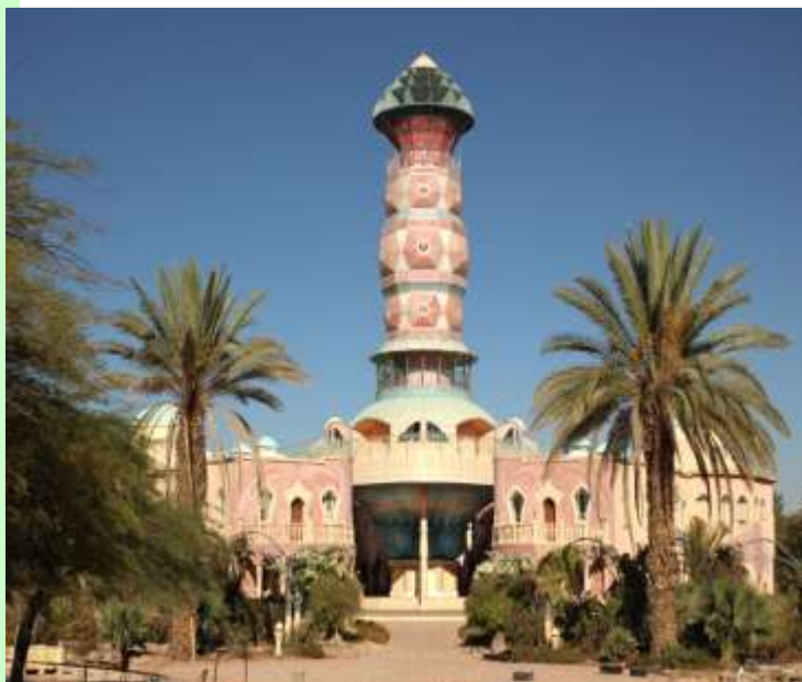
משכן סדנאות האומנות בנאות סמדר

ענת שאול מתיירות נאות סמדר מספרת למה נאות סמדר הוא מקום שלא יישכח... משק ז'ק בשדה יעקב פתח את המשק לקיבוץ עצמי כבר לפני יותר מ-20 שנה. ברכה גל יצאה לשם וחזרה עם רשמים על המשק ועל הפעילות התיירותית שבו. דובי וולפסון ביקר ביקב מישר ושמע מפי בעלי היקב על גידול הענבים, ייצור היין והתיירות החקלאית ובעיקר על הקשיים שנתקל בהם יזם קטן.