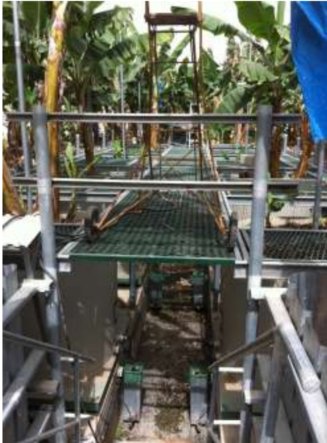
חוות הניסיונות בצמח

במסגרת הפרויקטים החדשים הוצע להתאים את החווה החקלאית בצמח לביקורי קבוצות, כולל פיתוח מערך תכנים לקהלים שונים; לפתח דרך חקלאית-תיירותית בשטחים החקלאיים; פיתוח שוק איכרים ועוד.