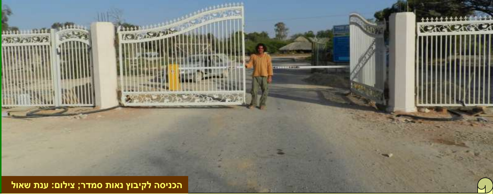
הכניסה לקיבוץ נאות סמדר

ת י י ר ו ן עלון אלקטרוני לענייני תיירות חקלאית* וכפרית מופק ע"י משרד החקלאות ופיתוח הכפר, הרשות לתכנון ושה"מ