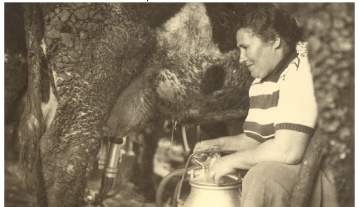
כפר ויתקין, 1955. חליבה מכנית

האתוס של נשים בעמק מדבר על נשים חזקות, ערכיות, בעלות עקרונות, כאלו שרצו לממש את החינוך שקיבלו בבית - חינוך שדיבר על תרומה ועל בנייה של חברה חדשה, מודרנית ושוויונית, חברה המושתתת על ערכי נתינה ושיתוף.