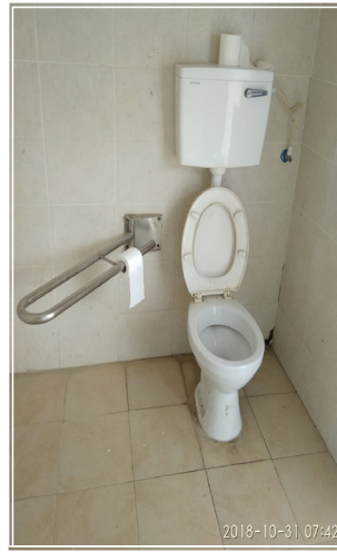
שירותים ציבוריים נקיים באופן מפתיע

אני מציע, אפוא, לוועדים המקומיים לשקול פעם נוספת האם לא ניתן להקציב תקציב לתחזוקת שירותים אלה כשהם פתוחים? לכל קיבוץ או מושב ישנם מוסדות ציבור שעובד בהם קבלן ניקיון וניתן להוסיף מטלה זו לתפקידיו. לאותם ישובים שרוצים אולי להפיק תועלת נוספת, והכוונה לתועלת חינוכית, ניתן להפוך את אחזקת השירותים לחלק מאחריות תנועת הנוער, כמו למשל להפכו לאחת ממטלות בר המצווה שאנו מטילים על הנוער. מקובל היום על המארגנים לחפש רק מטלות שיש בהן מן האתגר וכיף אבל למיטב זכרוני היו גם פעם מטלות שהן "שירות לחברה". אם נשקיע מעט בחינוך, ואם נכין שילוט שיציין כי ניקיון המקום הוא באחריות הנוער המקומי, נוכל לצוד שתי ציפורים במכה אחת וכולם יצאו נשכרים. מי מרים את הכפפה?