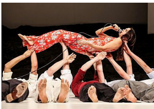
מחול מזורקה פוגו

כל מחוללי ואוהבי המחול המודרני נהגו לכנות את פינה באווש כ"האימא הכוריאוגרפית המעניינת ביותר המקורית והמשפיעה הגדולה ביותר בתחום הזה".