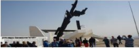
**דרגת קושי הטיוול: קלה (חובה להביא כיסא גלריה)**

ניסע צפונית לארגמן לביקור באתר מעניין שצורתו כצורת כף רגל. נעפיל (באוטובוס) לסרטבה וללא ביקור במצודה) לתצפית מדהימה על האזור. הפסקת צהריים במפגש הבקעה ומשם לאנדרטת הבקעה. חזרה דרך כביש אלון תוך כדי נסיעה נכיר את התיישבות לאורך הדרך. ונסגור את המעגל בירושלים.