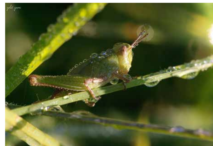
תפסתי ראש טוב על הבר. נימפה של חגב בבוסתן נען

מישהו רואה כאן נימפה של חגב בין גבעולי הדשא או שהעיניים שלכם כבר מבולבלות לגמרי?