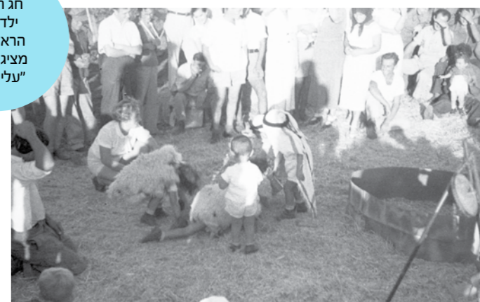
חג המים. ילדי נען הראשונים מציגים את "עלי באר"