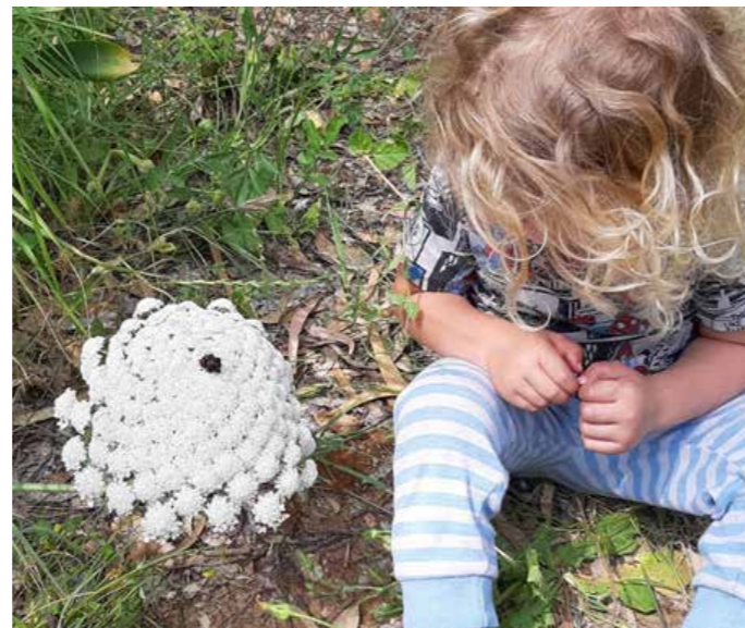
הזיהה מחיקויים. גזר קיפח עם חרק מזויף בחורשת חלופ

לגזר הקיפח יש תחפושת מקורית בהחלט - במרכז התפרחת הלבנה מתנוססת קבוצת פרחים עקרים, שחומים או סגולים, הנראים מרחוק כמו חיפושית או זבוב. חרקים אחרים שמתעופפים בסביבה רואים את החרק המזויף כשהוא בולט על רקע התפרחת הלבנה ונמשכים גם הם להאביק את הצמח. כי היי, אם "החבר" שלהם נהנה מהסעודה, למה שגם הם לא יהנו?