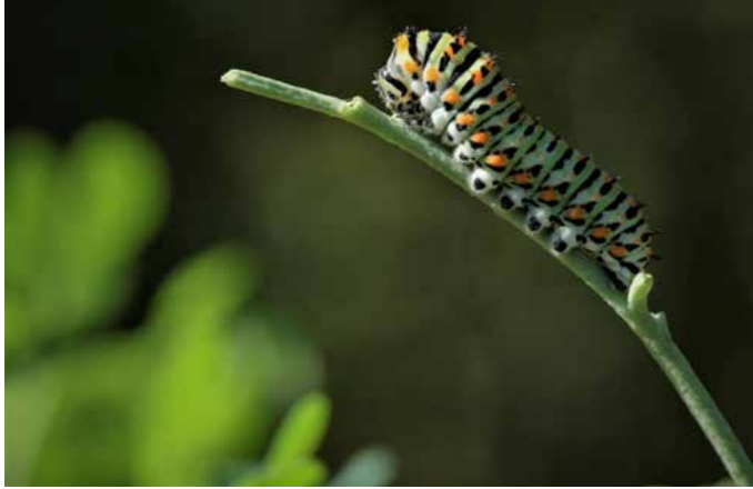
רעל בעיניים. זחל זנב הסנונית בגינת הפרפרים