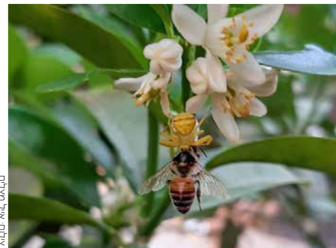
משלוח עד הבית. הדבורה לא עמדה בפיתוי וסיימה אצל הסרטביש הלימוני בבנדס

הדבורה המסכנה נמשכה לפריחת ההדרים הריחנית, אבל לרוע מזלה הפכה בעצמה לארוחת הצהריים של אחד הפרחים המפתים. אה, והפרח אינו פרח כמובן, אלא סרטביש לימוני בתחפושת. ככה זה כשהאוכל מגיע אליך ישר לצלחת.