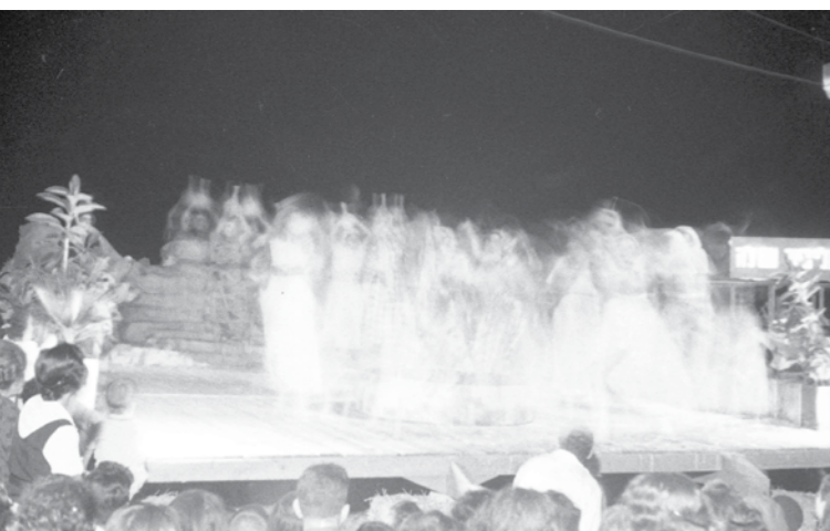
בנות נען על הבמה המרכזית. חג המים | צילום: אריה פק

"יהודה הביא את המנגינה 'ושאבתם מים', עיבד את השיר לתזמורת ועשיתי טקס שלם. הריקוד שלי התחיל עם צעד 'שכול חלוף' לצד שמאל, שהרגשתי שזה מבטא גלים של מים. החלק השני, הכניסה לאמצע, היה צריך לבטא את שאיבת המים או פריצת המים מן הקרקע. החלק האחרון של הריקוד העממי עם הניתורים אינו שלי. היו [בנוסח המקורי שלי] מחיאות כפיים, אבל לא ניתורים. הייתי צריכה לעשות צעדים פשוטים, כי אלה לא היו רקדנים, אבל לא רציתי שרק ירקדו הורה. רקדו את הריקוד הזה מעגל בתוך מעגל בתוך מעגל, שלושה-ארבעה מעגלים אחד בתוך השני."