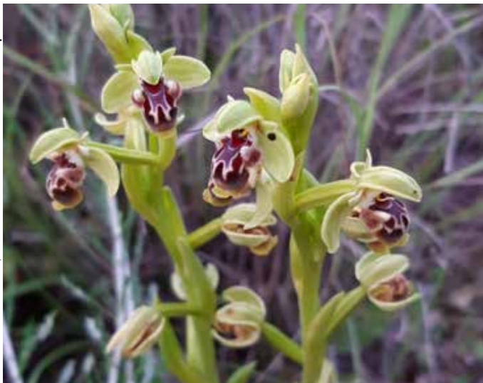
העתק של דבורה. דבורנית ליד חורשת חלופ

והמתחזה הגדולה מכולם, הזוכה בנשף המסכות המקומי, היא כמובן... הדבורנית!