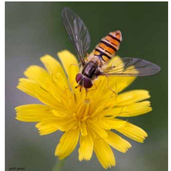
זו לא גברת זה אדון. זבוב מחופש בחורשת חלופ

כמעט. אבל לא. זו לא דבורה וזה בכלל לא עוקץ. הרחפן המתעתע הוא זבוב ממשפחת הרחפנים שהתחפש לדבורה. ותגידו לי אתם - מי יעד להתעסק איתו עם תחפושת עוקצנית שכזו?