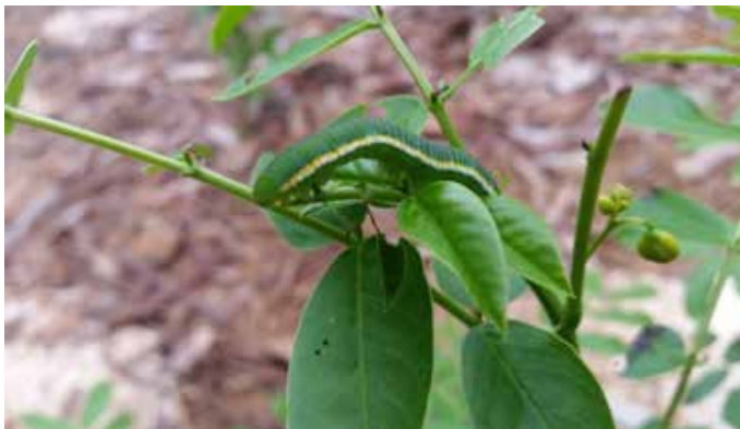
מתחפש לעורק של עלה. זחל של הגרן הסנא בגינת הפרפרים

הזחל של הגרן הסנא גדל בהמוניו על שיחי הכסיה הסוככנית השתולים ברחבי נען או על עצי כסיית האבוב שמתמלאים באשכולות של זהב בקיץ. אך למרות שהוא נפוץ מאוד רוב השנה (אפריל עד דצמבר), קל מאוד לפספס אותו - וזה רק בגלל התחפושת המצוינת שלו. הזחל מתחפש לעורק המרכזי של עלה הכסיה שעליו הוא גדל. טורפים יתקשו למצוא אותו בין סבך העלים בתחפושת כזאת. למעשה, גם אתם תתקשו לאתר אותו, אפילו אם עשרות זחלים יעמדו מול העיניים שלכם.