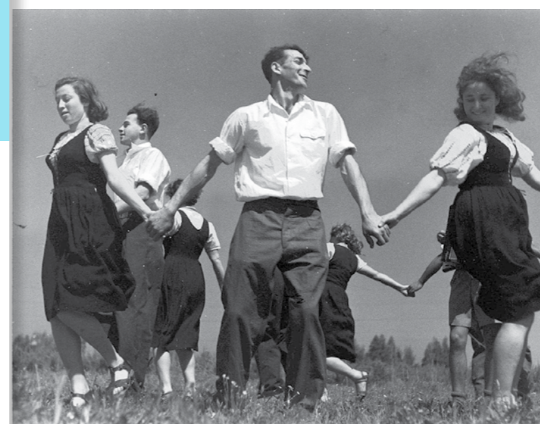
כנס המחולות הראשון בדליה, 1944

לסדרי החג הממשמש ובא. בין השאר מוזכרת החברה עליזה או אלזה שבאה מיגור יחד עם יהודה שרתוק (שרת) והייתה אמונה על הכנת התנועה לחג.