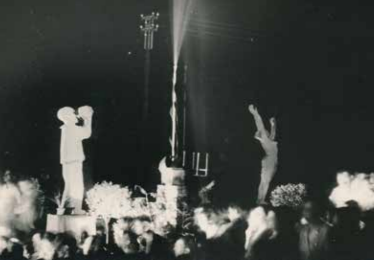
הבמה המרכזית בכיכר הקידוח. חג המים