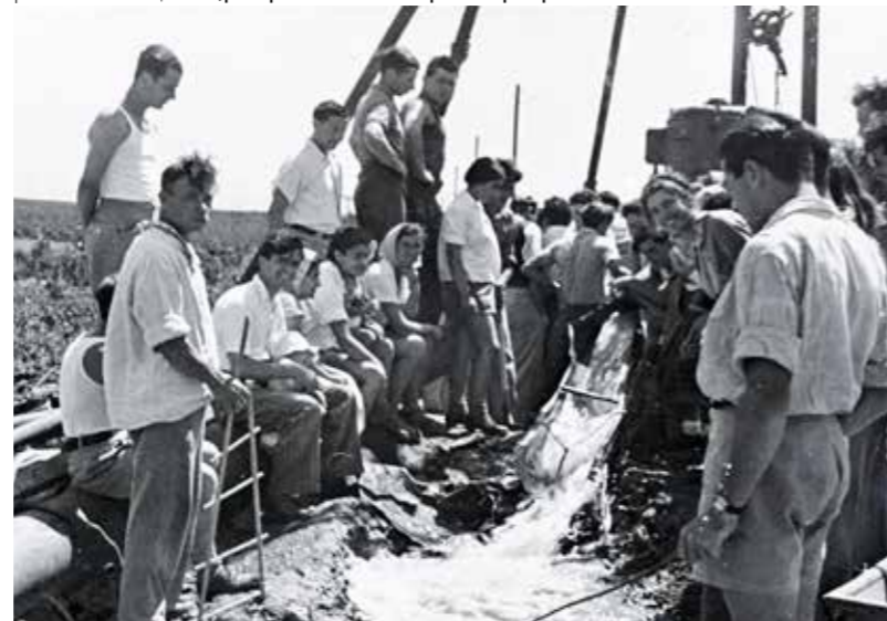
סוף סוף מים. קידוח מוצלח ראשון בנען, 1937