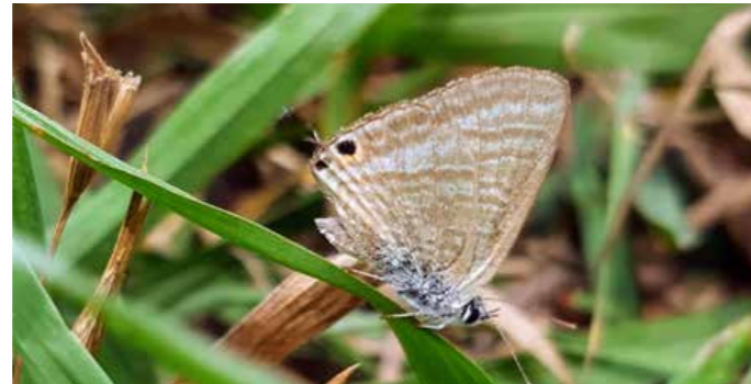
שומר ראש. כחלון האפון בדשא המעבדה

כחלילים רבים, כמו כחלון האפון שבתמונה, משתמשים בתחפושת יעילה מאוד כדי להתחמק מטורפים: הם מציירים על הכנפיים האחוריות שלהם זוג עיניים מדומות ומגדלים שני מחושים מזויפים מאחור - התוצאה היא ראש מדומה בצד האחורי של הגוף. כאשר הפרפר עומד ניח, הוא מזיז את הראש המדומה בתנועה מעלה-מטה כך שטורפים נמשכים באופן טבעי לראש המזויף. הפרפרים יכולים להמשיך ולהתעופף גם עם ביש דבזב, אבל לפחות הראש האמיתי נשאר שלם.