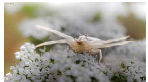
למי קראת גזר קיפח. סרטביש הפרחים בחורשת חלופ

סרטביש הפרחים התחפש כאן לתפרחת של גזר קיפח, ומחכה לטרף מזדמן; איזה זבוב חסר מזל או פרפר קטן. אגב, אם הסרטביש יעבור לפרח צהוב כמו חרצית או סביון - הגוון שלו ישתנה לצהוב! ככה זה כשיש לך כמה תחפושות בארון - אתה יכול לבחור את התחפושת לפי צבע הפרח או מצב הרוח שקמת איתו.