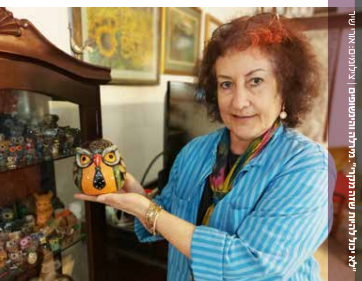
קיקה ויובל. חתיכה כמו אבא

הם חולפים לידיכם במדרכות, מדגמנים זוגיות יציבה על שתיים ועל ארבע. לפעמים דומים, לפעמים הפכים, אבל תמיד מחוברים. הכלבים והמאמצים - קבלו אותם בכשכוש זנב