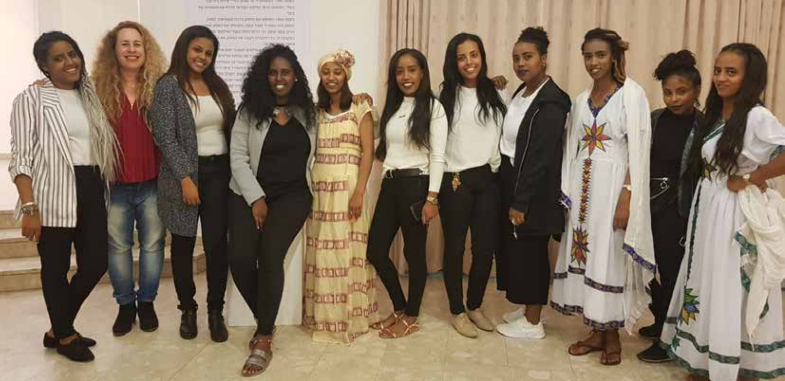
יום האישה, מרץ 2018. קבלת פנים מסורתית - בנות תל"מ מארחות את נשות נען