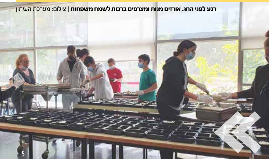
רגע לפני החג. אורזים מנות ומצרפים ברכות לשמח משפחות

בראש השנה הם הרימו פרויקט דומה, אז תרמו חברי נען 450 מנות שבושלו במטבח ושימחו משפחות רבות על שולחן החג. ביום המעשים הטובים שצויין החודש (16.3) התגייסו ילדי המרחבים בחינוך החברתי להכין ברכות אישיות, שיצורפו למנות היוצאות.