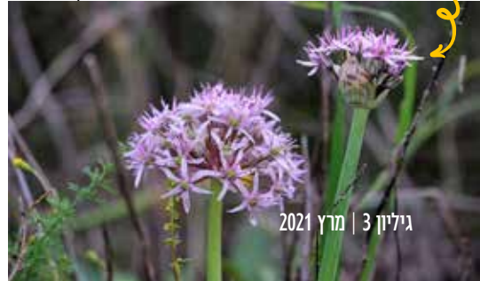
שום תל אביבי. ליד חורשת חלופ. צמח אנדמי למישור החוף