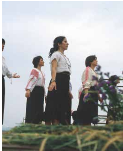
חוגגת העומר בתנו לאורך השנים