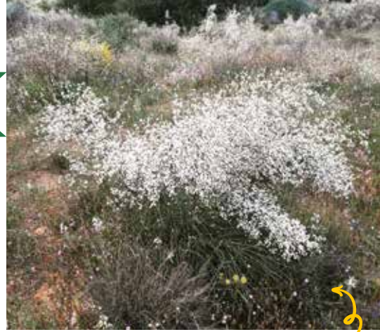
חמם המדבר. מרבדי הפריחה הלבנים שלו הם מהמאפיינים המפיים הבולטים של האזור בחורף

יש על מה לשמור! מהצומח הטבעי המאפיין את מרחבי החמרה של אזורנו. כל התמונות צולמו בנען