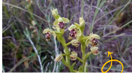
דבורית דינסמור. ליד חורשת חלופ