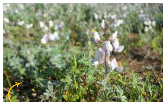
מרבד תורמוס ארץ ישראלי בשביל לבית הספר. עבודות עפר שבוצעו במקום בשנה שעברה פגעו אנושות בצומח באזור זה