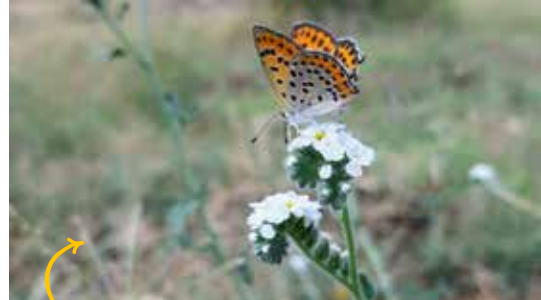
עוקץ עקרב. אחד מצמחי הקיץ הבולטים ביותר על אדמות חמרה משמש מקור צוף חשוב בעונה היבשה למאביקים רבים