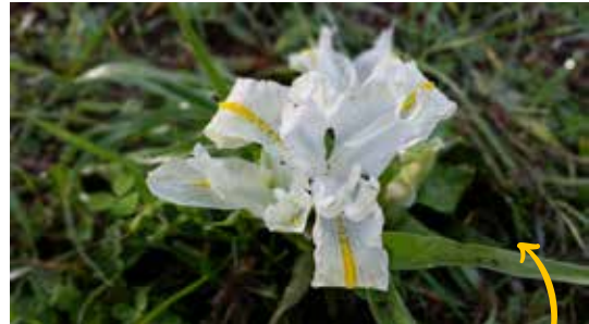
איריס ארצישראלי. צומח לא רק על אדמות חמרה אך אנדמי לארץ ישראל ומעטר את מרחבי הטבע בתחילת החורף