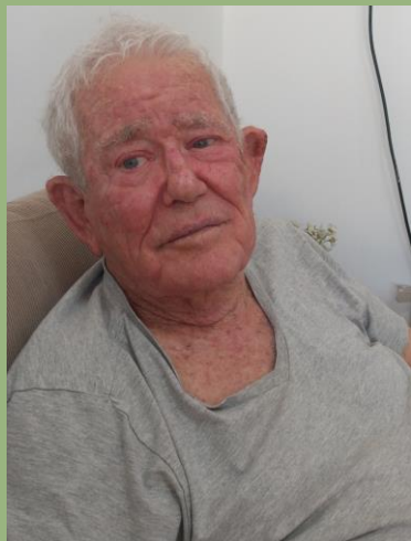
תחביבים: איסוף צדפים, קריאה, גידול קקטוסים.

קשר לאדם ואדמה: "מורה צריך לאהוב את תלמידיו ולהשתעשע איתם, לחזק ולהעצים את יכולותיו של כל ילד וילדה"