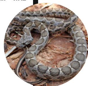
זעמן המטבעות - לא ארסי