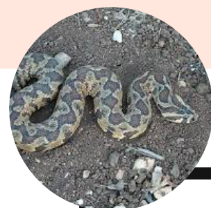
צפע ארץ ישראלי - ארסי