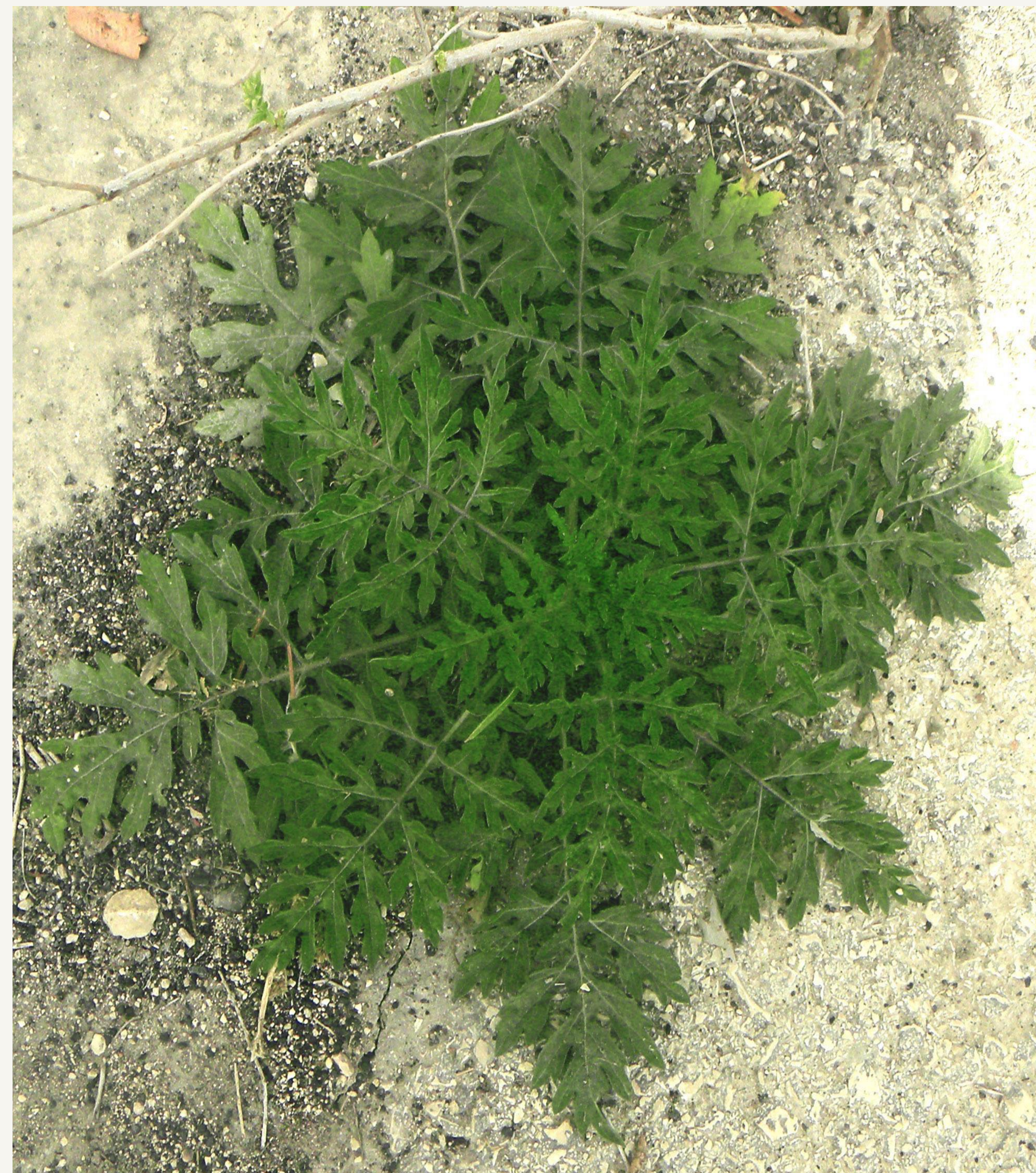
איור 2: צמח פרטניון אפיל צעיר בעל שושנת עלים גזורים ומנוצים