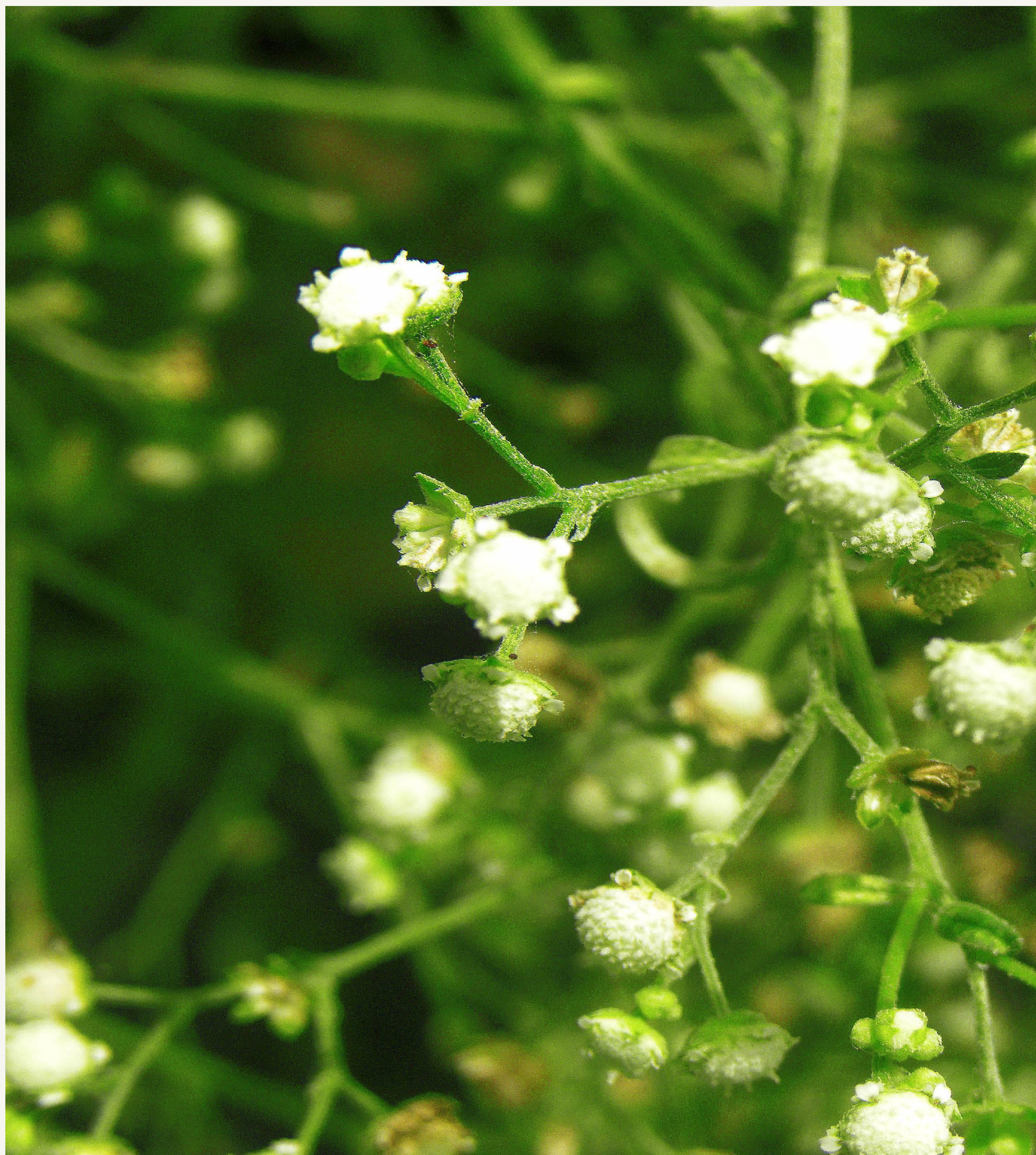
איור 3: ענף נושא תפרחות (תקריב). בהיקף התפרחת 5 פרחים לשוניים ובמרכז פרחים צינוריים עקרים