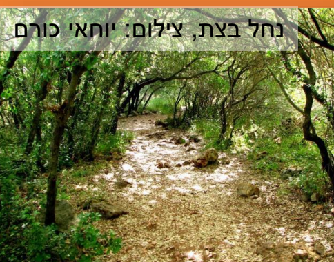
נחל בצת

היסטוריה ומורשת: תל אכזיב, מבצר יחיעם והמונפורט, מערת מנות, שיירת יחיעם, יד ל"ד, ראש הנקרה, תל כברי ורבים נוספים. בנוסף, הנחלים הגדולים ושמורות הטבע מרושתים במערכת שבילי טיול רבים ובעזרתם ניתן להגיע ברגל, באופניים וברכב אל שכיות החמדה הרבות שברחבי המועצה ואף מעבר לה.