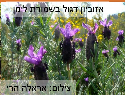
אזוביון דגול בשמורת לימן