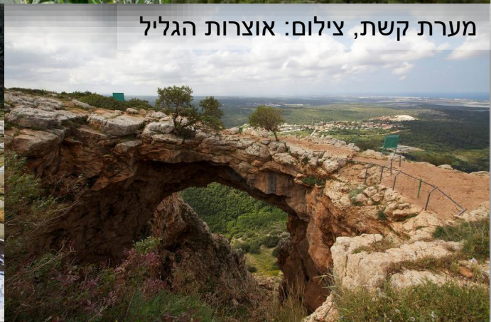
מערת קשת