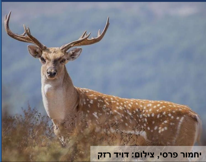
יחמור פרסי

השטחים הפתוחים במועצה חשובים במיוחד לשמירה על מינים בסיכון, דוגמת היחמור הפרסי שהושב לטבע לאחר שנכחד בתחילת המאה ה-20