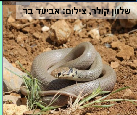
שלון קולר

במרחבים הפתוחים הללו מתקיים שפע של מיני חי וצומח אופייניים לאקלים הים-תיכוני, ומהם מינים רבים שנמצאים בסכנת הכחדה: 122 מיני צמחים, 3 מיני דו-חיים, 11 מיני זוחלים, 44 מיני ציפורים, 25 מיני יונקים ומין דג אחד.