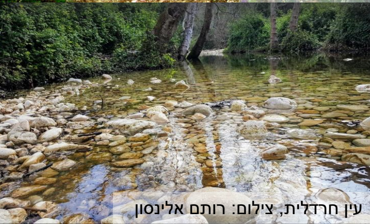
עין חרדלית