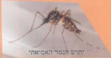
יתוש הנמר האסיאתי

מקורות הדגירה העיקריים נמצאים במים שבחצרות הבתים!