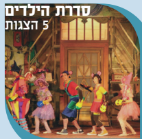
סדרת הילדים סדרת מוסיקה 3 מופעים