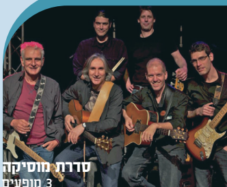
סדרת קולנוע ישראלי עדי בילסקי אביב אלוש

מחירים מיוחדים ובלעדיים לתושב גליל תחתון.