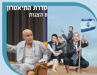
סדרת התיאטרון 8 הצגות