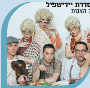
סדרת הילדים סדרת יידישפיל 3 הצגות