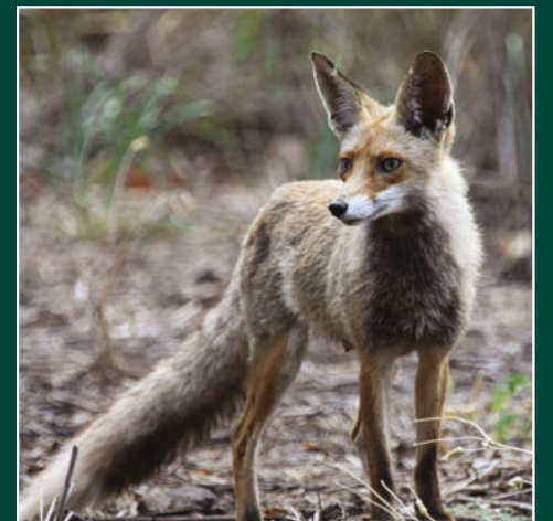
שוועל מצוי