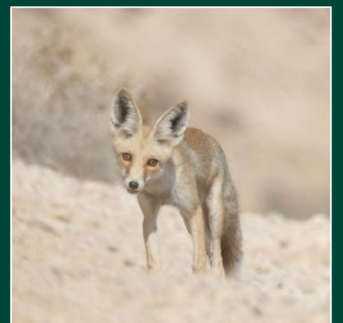
שוועל מצוי