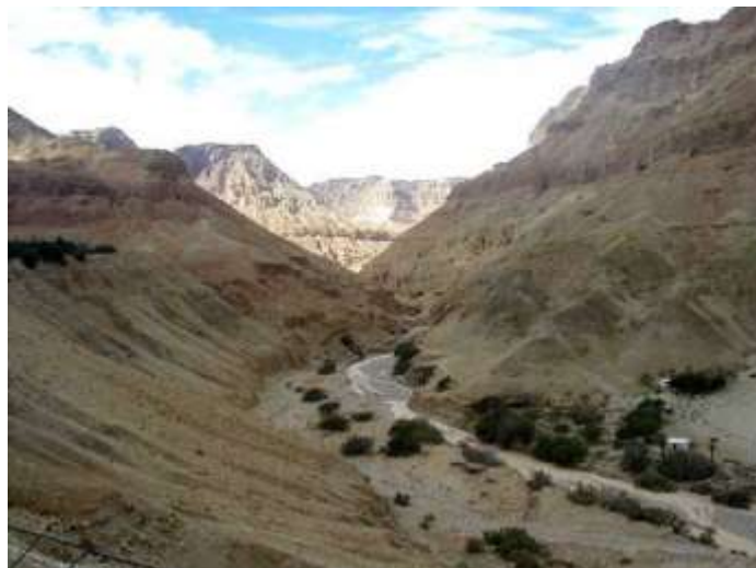
בתמונה - נחל קומראן

לבעלי חיים המרוכזים בשמורה-שועלים, צבועים, זאבים ושפע של עופות מים.