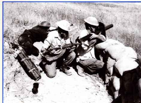
חברי בחן במהלך מלחמת ששת הימים