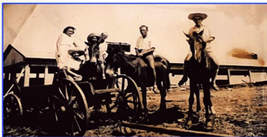
ראשוני חברי משמר השרון עם הפרדות, הסוס והעגלה שלקחו חלק בניית הקיבוץ.