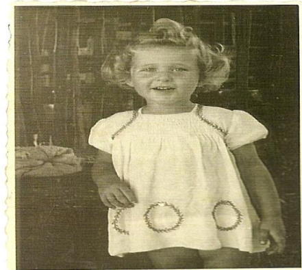
דסקה בת שנתיים בשמלה שרקמתי לה לכבוד חג השבועות