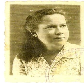
תמונת אילן תלפנת הנהגות- 1946

14-17 והם שמשו העזרים שלי והמקשרים- מדיעים לתושבים הודעות, כי היה טלפון יחידי במחכירות של צופית שהייתה בבית העם. אח"כ מינו אותי לסמלת קשר חבלית ב"הגנה"- אחראית על הקשר בכל הישובים שמסביב לצופית (עד רעננה ומשמרת שבגוש תל- מונד). התקשרנו בעזרת פנס איתות בלילות מעל הבריכה, ובהליוגרף- ביום. הטלפון נותק לעיתים קרובות על ידי הערבים. כך נשאר האיתות כקשר כמעט יחידי מדי פעם. התורנים שלי למשמרות הלילה ישנו על בימת בית- העם במיטות מתקפלות. בכיבוש מיסקי הערבית על פורעיה (לפני קום המדינה) עמדתי על הבריכה וקיימתי קשר עם רמת הכובש, כיוון שהערבים חתכו את כבלי הטלפון. למטה עמד אחד ממפקדי הפעולה, איש ה"הגנה", ונתן לי הוראות- מה להודיע לרמת- הכובש בקשר לפעולה, מאין לשלוח תגבורת וכו'.