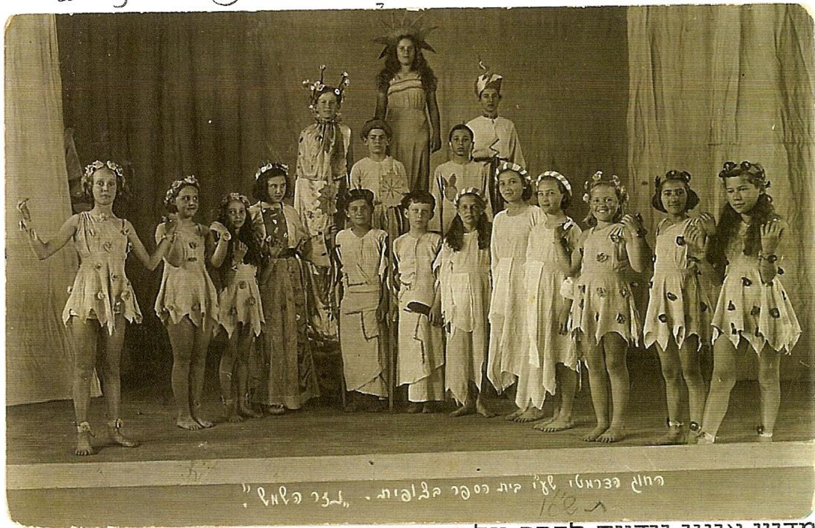
חוג כנאותי לעז' בית הספר הבלמאות. "לזר פלואל" 1927

הכיתה א: הבלמאות שבה אלו-תקראו הכיתה אהרנא 2 הצגות.