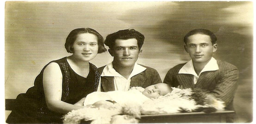
הבכורה לבית שפירא

סיפור שני מפיה של אימא: פעם נאלצה להכריע הכרעה רצינית- מה תקנה לארוחת הצהריים כשבידה רק גרוש וחצי (מתוך 17.5 גרוש ליום, שאבא הרוויח בעבודה בפרדסים, כשבגרוש היה חודו!). "פתרתי" לה את הבעיה כשגיליתי בחנות הירקות תיבה ובה אגסים עטופים בנייר ריחני (נגד חרקים) ואחד מהם, יפה ומעורר תיאבון, רק בו תפצתי מעטים אכלו אז פרי זה שהגיע מחו"ל והיה יקר מאד. אמר, שאכלה בילדותה אגסים רבים, לא יכלה לשאת את המחשבה שבתה יקירתה לא תטעם מפרי מגדים זה וקנתה לי אגס! מהכסף שנותר קנתה כמה ביצים ועגבניות. לארוחת הצהריים הוגשו חביתה וסלט. וכי אפשר לזכור סיפור כזה שאירע בהיותי בת שנה וחצי?