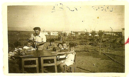
הצגה א': ה'אגרוף פוארת בחצ'ר המלכה-המלך נפוליאון ארנך