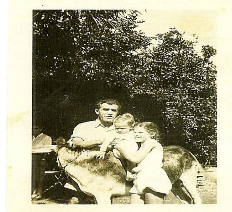
3 דורות: סבא, בת ונכד והאתון...