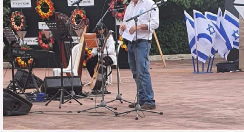
בעקבות הכתבה שהופיעה ב"ישראל היום", התראיינתי ברדיו בתכנית של אראל סגל ולחדשות הבוקר בערוץ 14 בתחילת השבוע.

"לפני שבועיים וחצי חגגנו בפסח את יציאת אבותינו ואמהותינו מעבודת מצרים. בעוד חודש נחגוג את מתן תורה במעמד הר סיני. אירועים מכוננים לעם ישראל. עם ישראל נפוץ לתפוצות וגלויות ברחבי תבל. אמהותינו ואבותינו גורשו, נרדפו, הוגלו, הופלו וגם נרצחו. בהמשך עשרות דורות חלמו והתפללו לגאולה ולישיבה לציון, לארץ ישראל. שבנו לציון, אנו נאחזים באדמתו ומקימים ערים, עיירות וכפרים. אנו עוסקים בבניה, בפיתוח, בייצור וביצירה. אנו גם עוסקים בהגנה על עצמנו, על משפחותינו, קהילותינו, אדמתנו ומדינתנו. 23,816 חללי מערכות ישראל נפלו ב-150 שנה. אנו מכבדים את זכרם ומחזקים את משפחותיהם. אנו נזכרים באחינו ואחיותנו שנפלו, ומהרהרים בגורל שהטיל עלינו את שמירת מורשתם, הגשמת חלומותיהם וביצוע ציווים. אנו היום מחדשים את הברית והמחויבות איש ואשה לאחיו ואחותו, לאדמת ארץ ישראל ולמדינת ישראל. ידינו מושטות לשלום עם אויבינו, ופנינו לשלום תמיד. אבל אנחנו נגן על עצמנו, על אדמתנו ועל מדינתנו כל עוד נפשונו בנו. אני מבקש למסור ניחומים למשפחות השכולות. אני מבקש לזכור את אחיי ואחיותיי שלי, של הוריי, של ילדיי, של קהילתי, של עמי ושל מדינתי שנפלו במערכות ישראל בשירותם ובפעולות האיבה. אני מבקש למסור לתלמידי בתי הספר ולדור ההמשך שהשמרת שלהם הולכת וקרבה. כולנו מאוימים, כולנו על הכוונת של מישהו. לכולנו אחריות להגן על עצמנו, על קהילתנו ועל מדינתנו. היום אנו זוכרים את הנופלים, מחר נחגוג את קוממיות מדינתנו ועצמאותנו, מחרתיים נשוב לבנות ולפתח, לחקור, לייצר ולהתקדם. אני מסובב את הקשב שלי ומכוון בנפשי לזכר הנופלים. יהי זכרם ברוך!"