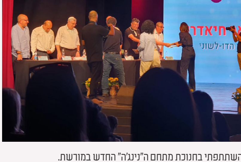
השתתפתי בחנוכת מתחם ה"ינג'ה" החדש במורשת.