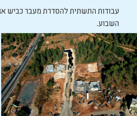
הושלמה השבוע בניית מבנה רב תכליתי ביישוב דמיידה.